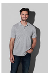
ST9060 C Harper Polo